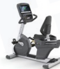
Горизонтальный велозергометр R7xi