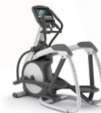
Эллиптический эргометр E7xi