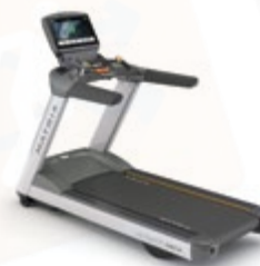
Беговая дорожка T7xi

Адаптируйте интерфейс консоли 7xi для отображения вашего бренда, доставляйте информационные сообщения и вовлекайте пользователей с помощью сообществ в социальных сетях. Вы даже можете добавить календарь с расписанием занятий для продвижения конкретных классов, соревнований, специальных акций, событий и др.