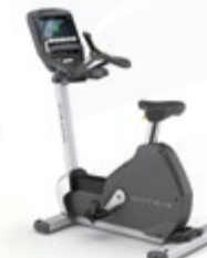
Вертикальный велозергометр U7xi