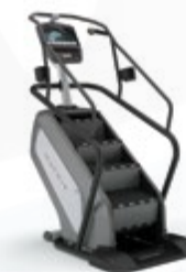
Климбер (лестница-эскалатор) C7xi