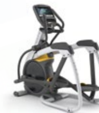
Эллиптический эргометр с изменяемым углом наклона рамы A7xi