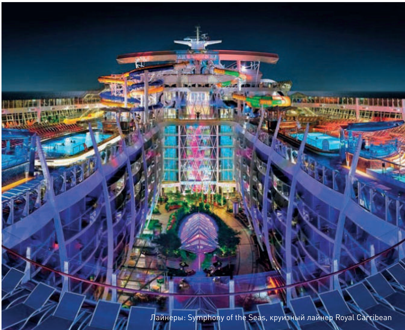
Лайнеры: Symphony of the Seas, круизный лайнер Royal Caribbean