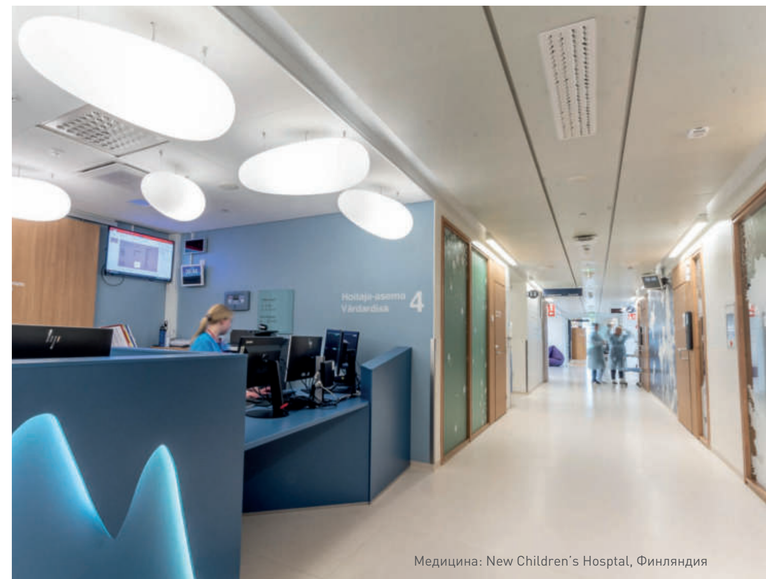
Медицина: New Children's Hospital, Финляндия