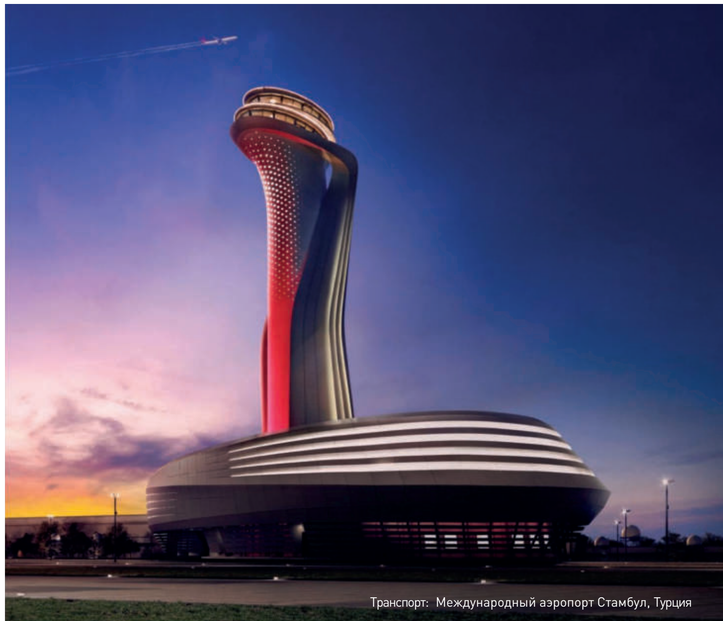
Транспорт: Международный аэропорт Стамбул, Турция