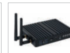
Облачные сервисы. Модуль HCG