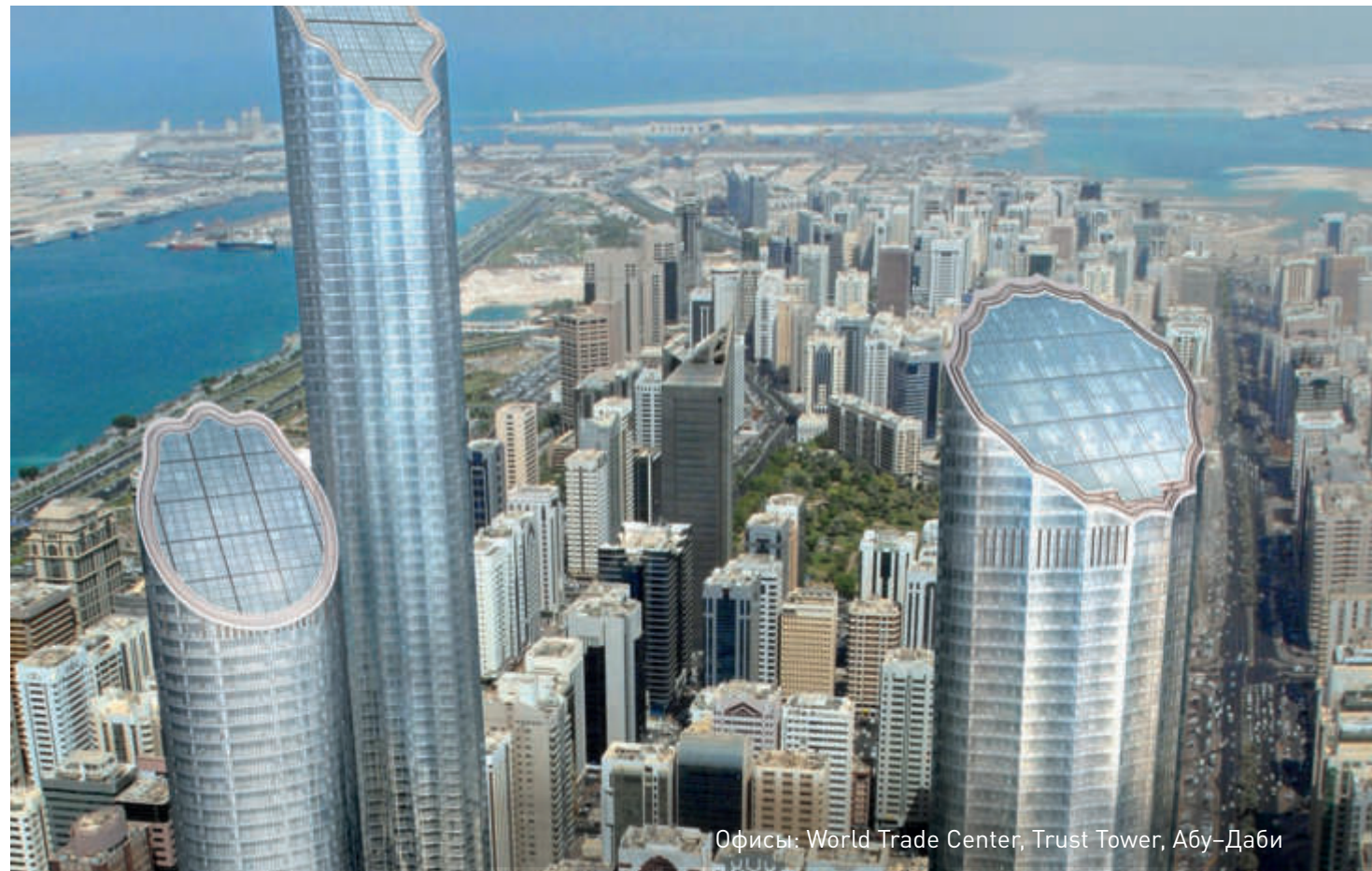
Офисы: World Trade Center, Trust Tower, Абу-Даби