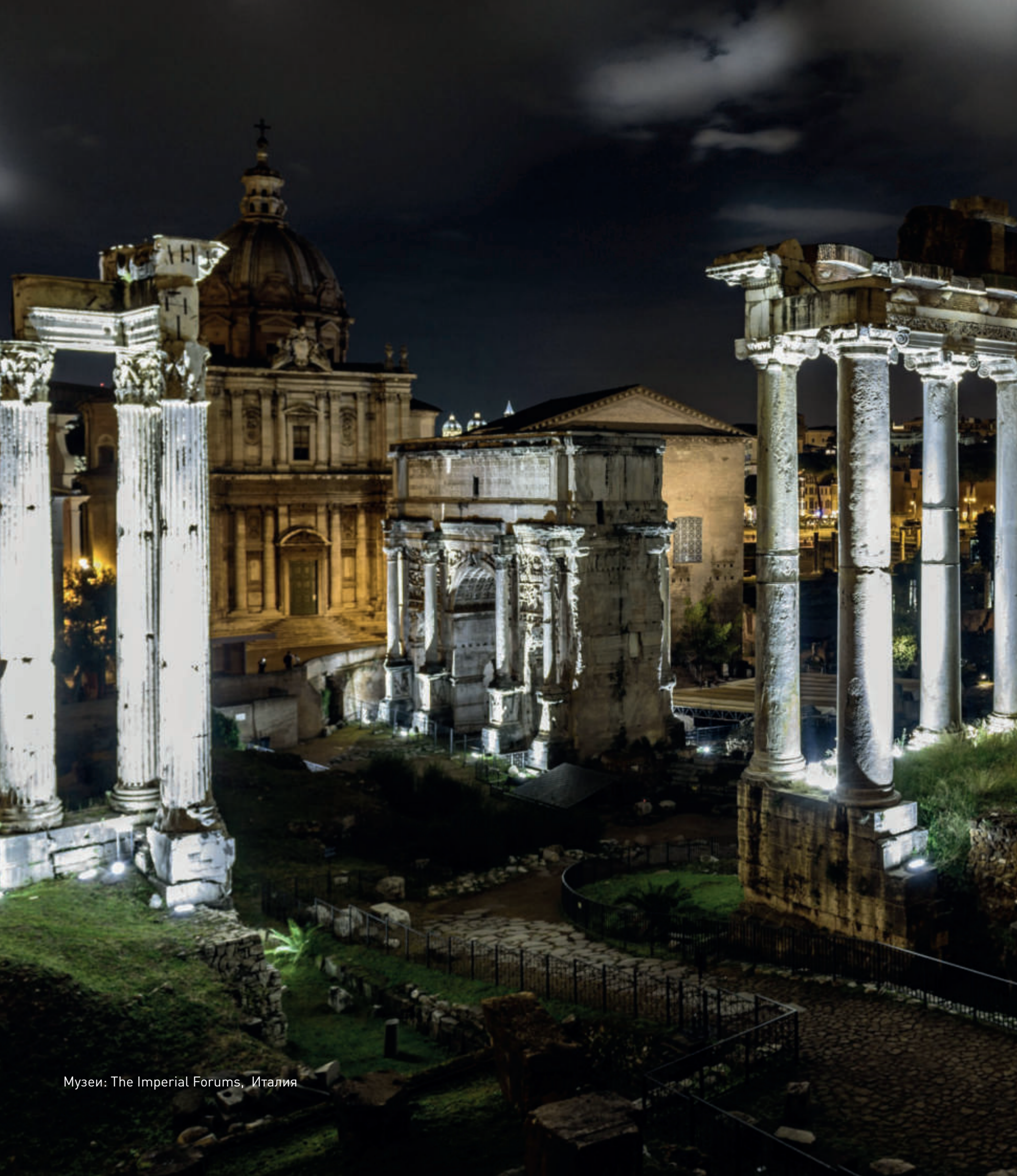
Музеи: The Imperial Forums, Италия